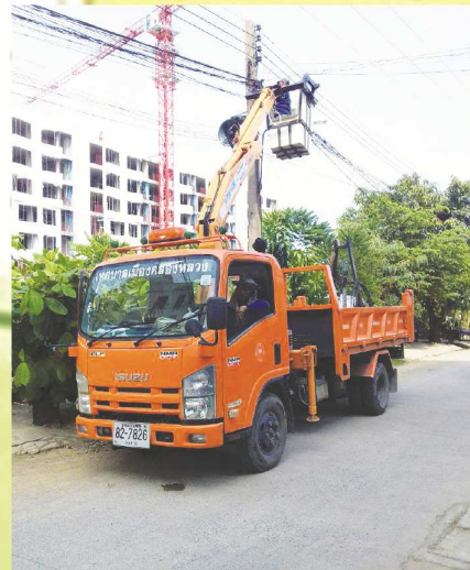
งานสถานที่และไฟฟ้าสาธารณะ ซ่อมแซมไฟทางชอยหงสกุล หมู่ที่ 3 ต.คลองหนึ่ง