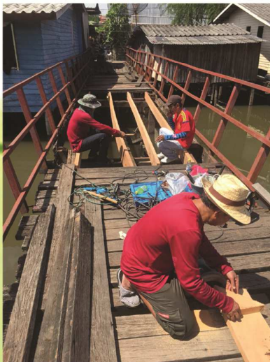
ฝ่ายโยธา งานสาธารณูปโภค ซ่อมแซมสะพานไม้ หลังหมู่บ้านพรทวีวัฒน์ 1