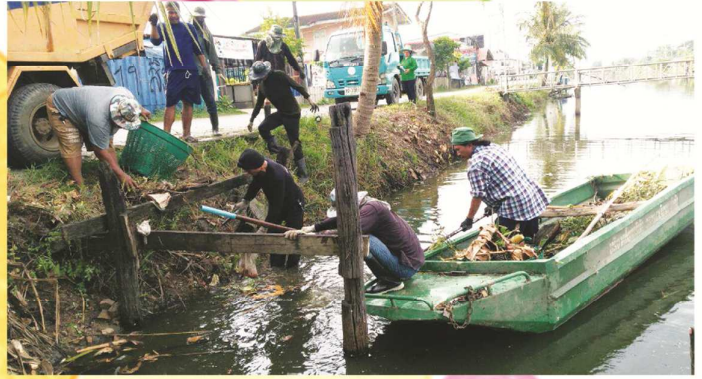
ปรับปรุงภูมิทัศน์ บริเวณเลียบบคลองระบายน้ำที่ 2 ต.คลองสอง โครงการคลองสวยน้ำใส