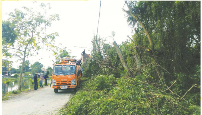
ฝ่ายควบคุมอาคารและผังเมือง งานสวนสาธารณะ ตัดต้นไม้ชอยบงกช 32 หมู่ที่ 2 ต.คลองสอง