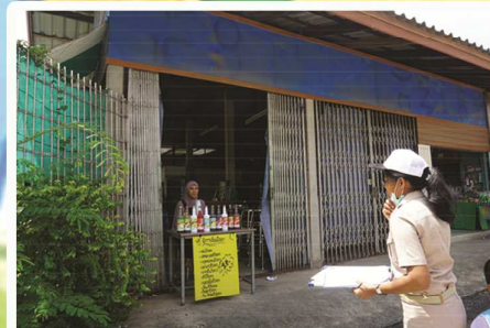
ตรวจบ้านเช่า ซอยเจ็ดพี่น้อง